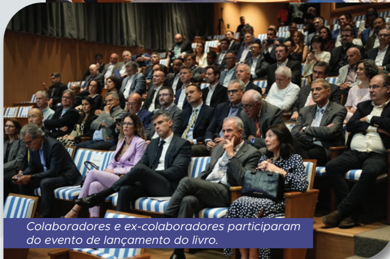
Colaboradores e ex-colaboradores participaram do evento de lançamento do livro.

A Jirau Energia lançou, na noite do dia 10 de março, em Brasília, o livro “Jirau, muito além da energia: uma história de sonhos e transformação”, que registra a trajetória da Usina Hidrelétrica Jirau e os principais marcos do empreendimento desde o leilão de concessão até a operação atual. O evento foi realizado na sede da Agência Brasileira de Promoção de Exportações e Investimentos (ApexBrasil).