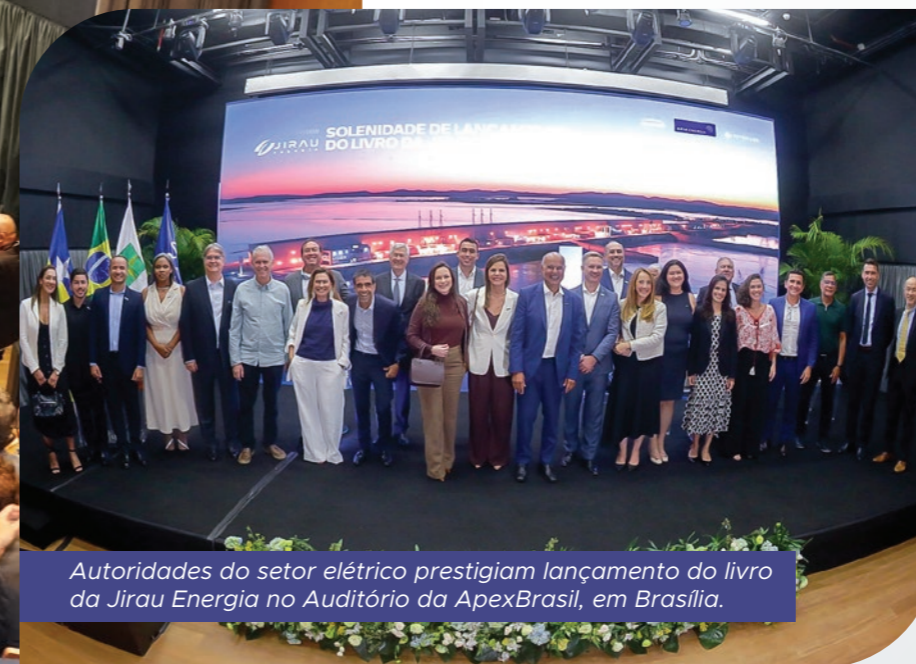
Autoridades do setor elétrico prestigiam lançamento do livro da Jirau Energia no Auditório da ApexBrasil, em Brasília.